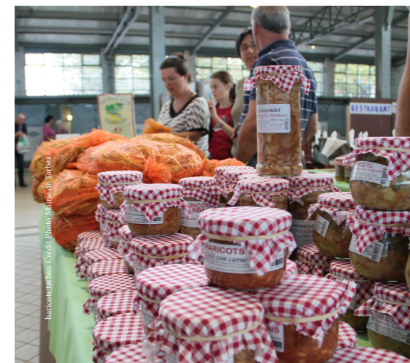
haras-tarbes - Credit Photo: Mairie de Tarbes