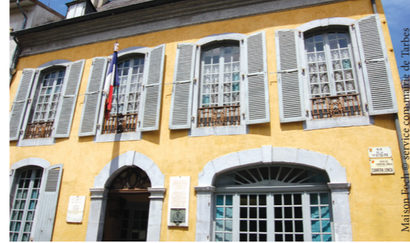
Maison Foch - service communication Mairie de Tarbes