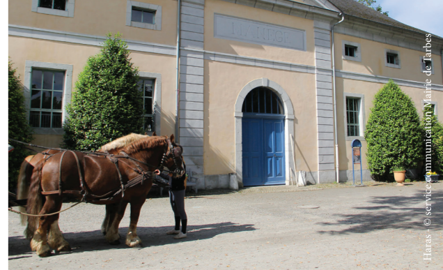
haras-tarbes - Credit Photo: Mairie de Tarbes