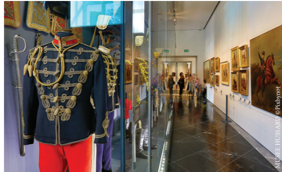
MUSEE HUSSARD