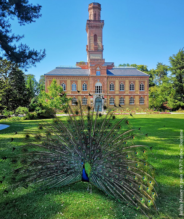
Jardin Massey et piano en V.P. Tarbes - Bourisamir