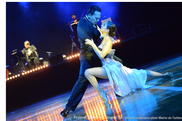
Festival Tarbes en Tango 2026 - Service communication Mairie de Tarbes