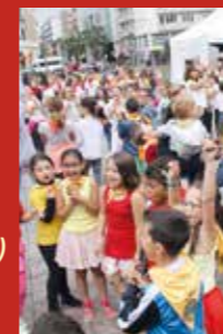
Mainats en Canta

avec les chants traditionnels balkans de Mesechinka .