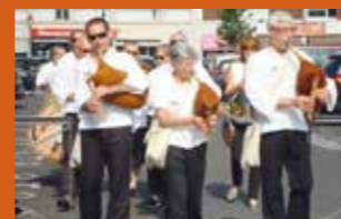
Boha qui Pot

Venez chanter, danser ou simplement écouter cette partie de chants spontanés à plusieurs voix.