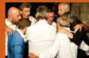
La Squadra di Genova